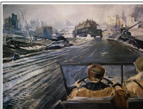
Ю. Пименова «Фронтовая дорога»

Учитель. Совсем недавно здесь шли бои. Об этом рассказывают подбитые фашистские танки, разрушенные здания, ещё горящие постройки. Воины советской армии переезжают ближе к фронту. В кузове грузовиков солдаты, к машинам прицеплены орудия. Опять впереди бои и новые победы над фашистами! А на этой дороге будет мир и тишина!