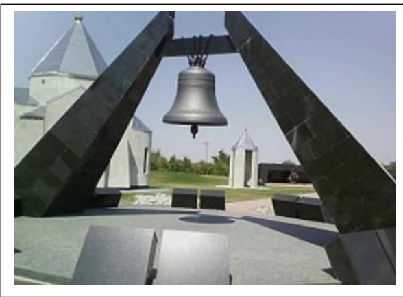
Мемориал детям концлагеря «Красный»