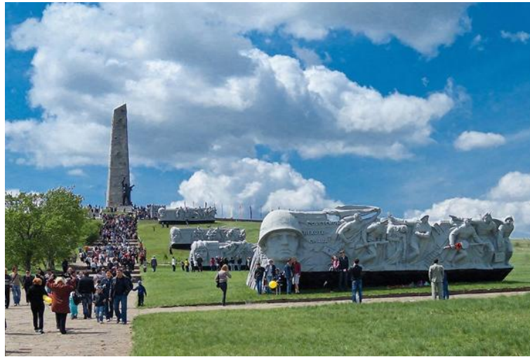
Мемориальный комплекс «Саур-Могила» в Донбассе

нацизмом. Во время боев в 2014 году он был разрушен новоиспеченными фашистами. А в 2022 году силами России памятник был восстановлен.