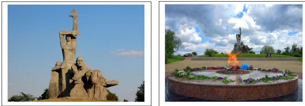
Мемориал жертвам фашизма «Змиёвская балка»

Дети рассматривают и обсуждают фотографии мемориалов. Учитель акцентирует внимание детей на символике колокола, цветов и игрушек у скульптуры ребенка, фигур, вечного огня мемориала «Змиёвская балка».