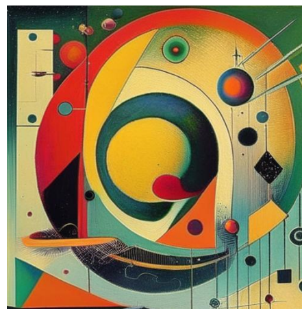
Ответ: Орбитальная станция

После ответов обучающихся педагог рассказывает о Дне космонавтики и о том, что освоение космоса – направление, в котором Россия была и остается первой и переходит к демонстрации видеоприветствия Борисова Юрия Ивановича.