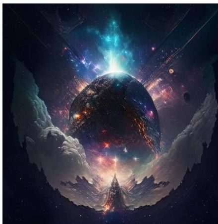
Ответ: Покорение космоса