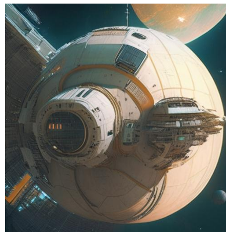
Ответ: Орбитальная станция