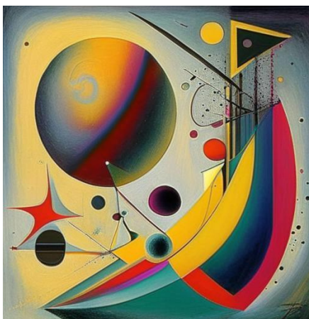
Ответ: космическое исследование

Далее представлены картинки в стиле работ русского художника-авангардиста Василия Васильевича Кандинского.