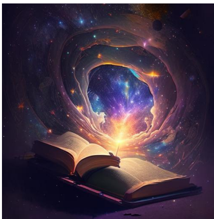
Ответ: космическое исследование